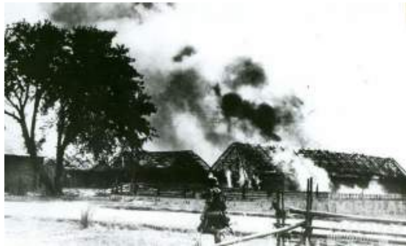
Начало боевых действий фашистской Германии против СССР