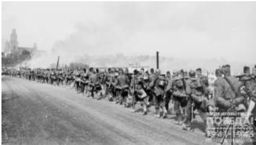
Вступление германских войск в Гродно

Дата, разделившая жизнь на до- и послевоенную для всей страны, для каждой семьи. Дата, за которой стоят миллионы сломанных судеб, разрушенные города, стертые с лица земли деревни и невероятный подвиг защитников нашей Родины.